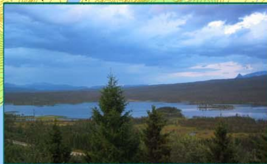
Østervikvannet (Snubbavannet) sett fra Snubba